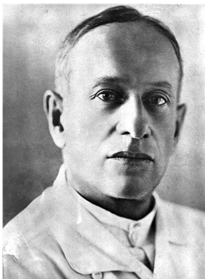
150 лет со дня рождения Д. П. Кузнецкого