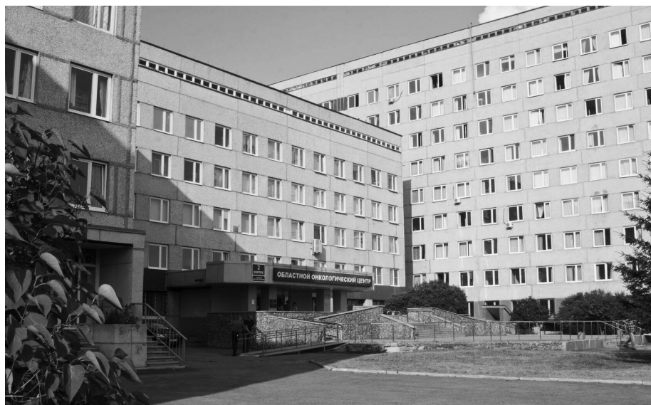
25 лет назад в Екатеринбурге был введен в эксплуатацию комплекс нового онкологического центра.