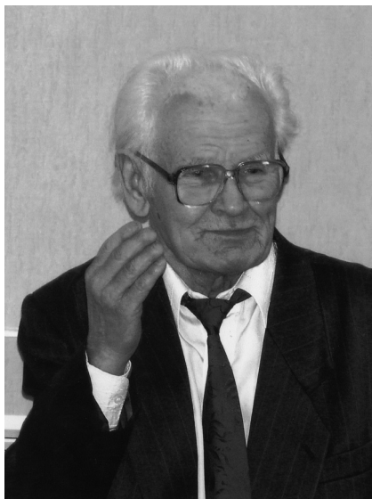
100 лет со дня рождения Г. К. Цициковского