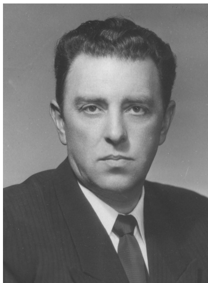
100 лет со дня рождения М. Л. Шулутко