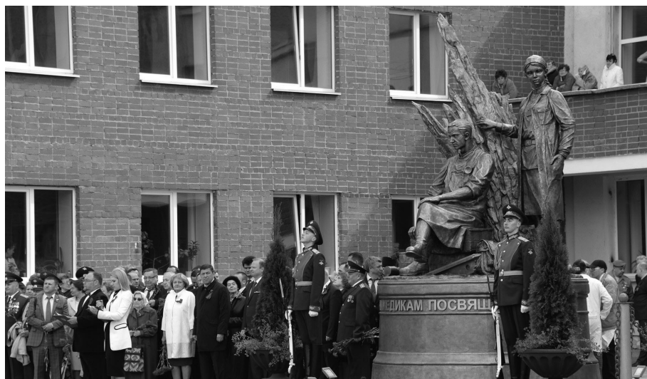
10 лет назад на территории Свердловского областного госпиталя для ветеранов войн был открыт памятник военным медикам.