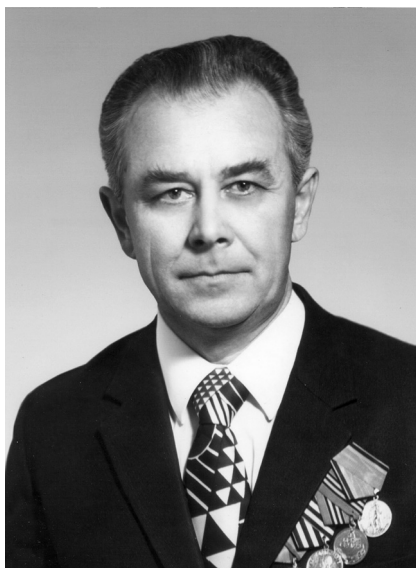
100 лет со дня рождения А. В. Житкова