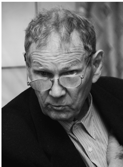
100 лет со дня рождения А. Д. Бальчугова