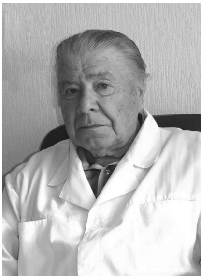
100 лет со дня рождения И. Е. Оранского